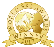
Japan's Best Ski Hotel